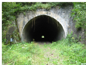
ein ca. 300 m langer Tunnel