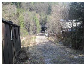
ca. 11 km Strecke